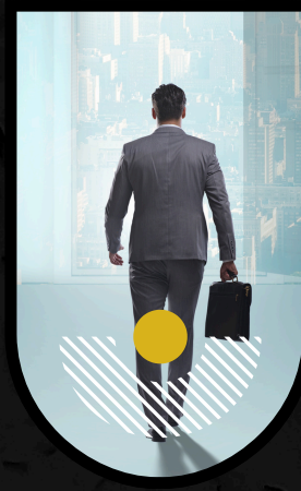
Chief Executive Officer